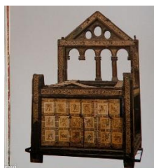
Abb: der hölzerne Stuhl, der im Kathedra-Altar von St. Peter in Rom als Stuhl Petri verehrt wird.